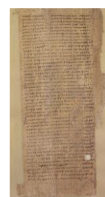
Στήλες κειμένου από διαφορετικά μαγικά εγχειρίδια που ανήκουν στη Μαγική Βιβλιοθήκη των Θηβών (GEMF 15, 16, 30, 57)